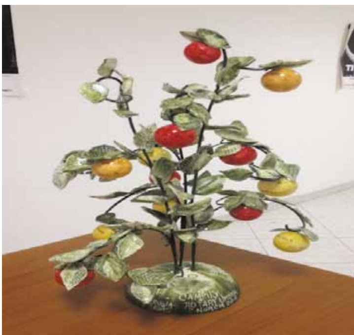
l'albero dei buoni frutti dei Rotary Umbri