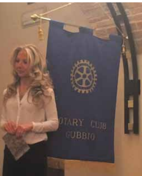
La presentazione della serata