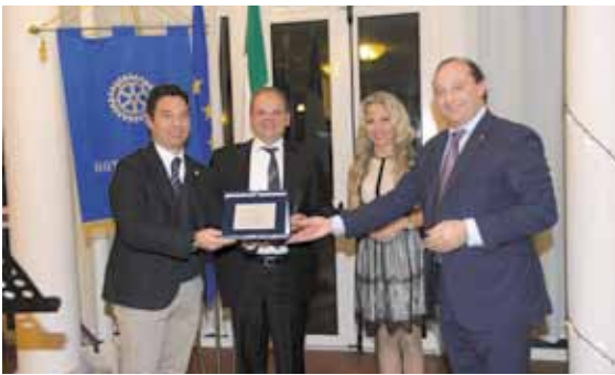
Riconoscimento alla PASTORALE GIOVANILE ... UFFICIO PELLEGRINAGGI, TEMPO LIBERO, SPORT per la collaborazione avuta