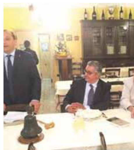
Introduzione della serata