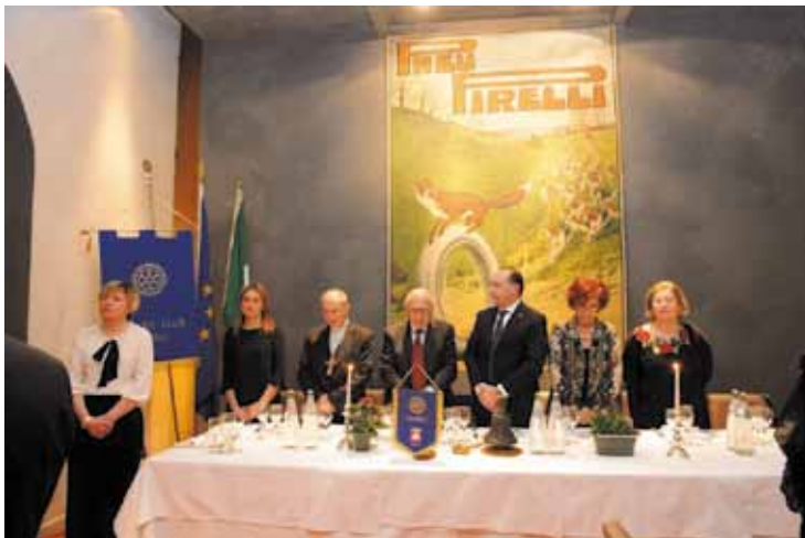
Inizio della Celebrazione