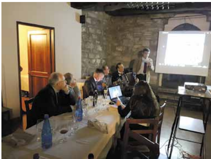
Immagine della serata