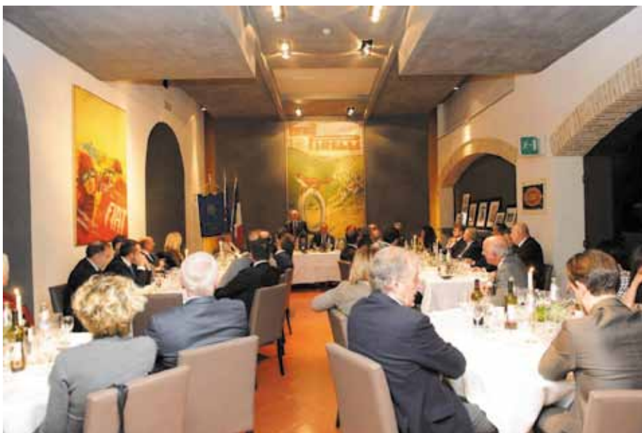
Soci ed ospiti presenti all'incontro