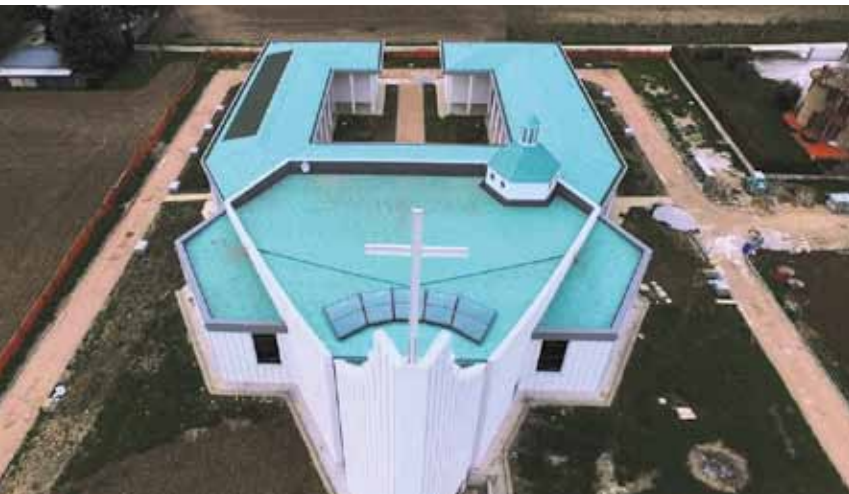
Immagine della nuova Chiesa